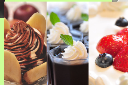
夕食後はデザート