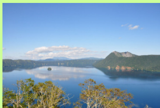
道東の湖、 満天の星、 動物たち、鳥たち