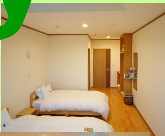
全室 北海道ビュー