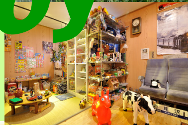
図書コーナー、鉄道グッズにおもちゃ箱