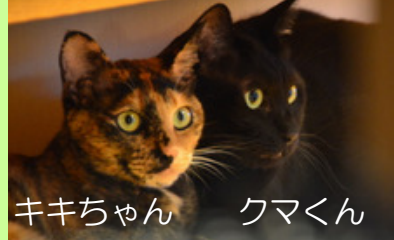
キキちゃん クマくん