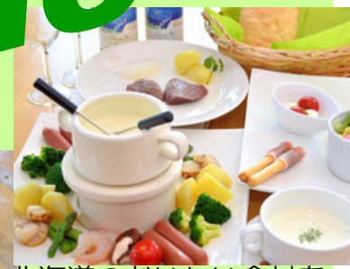
北海道のおいしい食材を