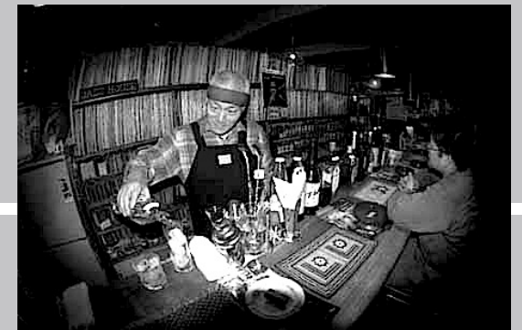
ジャズハウス キングコング浄土氏

ブルースでありながらフォークっぽくもあり鬼頭な音楽なんですね。鬼頭ライブももう 6 回目ぐらいかな。ふしぎやで初めて聞いてさらに ARtINn 極寒藝術伝染装置で引き継いでいます。彼の CD を聞くほどにライブが楽しくなり、さらに愛着が生まれる。