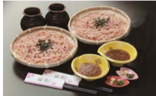
芝桜公園売店の協賛メニュー

5 月 11 日から 6 月 30 日まで、地元又は道内食材を使用し、「白つつじ」又は「芝桜」をイメージするご当地メニューを期間限定で提供するキャンペーン事業で、町内 18 店に協賛を頂き、更に、初めて東藻琴の芝桜公園内の売店にも協賛して頂きました。