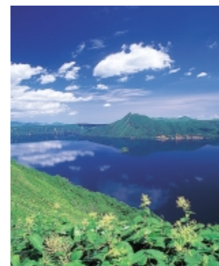
周囲20km、平均水深は145.9m、最大水深212mのカルデラ湖。海拔351m、湖底の高さは139mで、川湯温泉街より上に大きな水瓶があるのである

もうひとつの感動が、光に彩られる摩周湖。氷が解け始める4月ころから10月初旬までの朝焼けが最も素晴らしいと言われている。第三展望台から望むと、まだ眠っている摩周湖の向こうに確かな曙光が現れ、たちまちのうちに摩周岳の稜線に沿って朝陽が昇っていく。