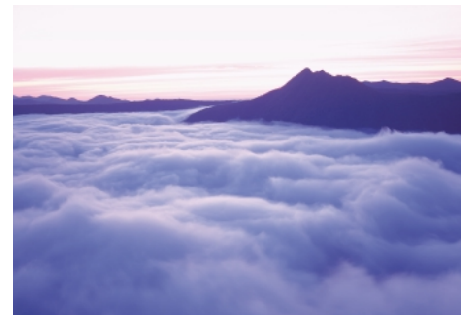
【摩周湖の環境保全の取り組み】 摩周湖と同湖を取り巻く周辺一帯の環境を良好な状態を保ちながら次世代に継承するといった取り組みをはじめます。この取り組みを通じて、世界的にも貴重な摩周湖周辺の環境を、次の世代により良い状態で継承していきます。